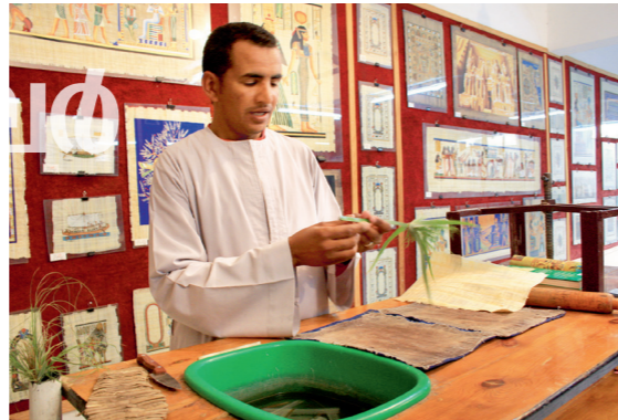
▲ പാപ്പിറസ് നിർമ്മാണം

(സ്കരാബ് ബീറ്റിൽ) ആണ്. ഏലസ്സ്, ലോക്കറ്റ്, ഫ്രീജ് മാഗ്നറ്റ് തുടങ്ങി പല രൂപത്തിൽ ഇവയെ സുവനീർ ഷോപ്പുകളിൽ കാണാം. പുരാതന ഈജിപ്തുകാർ സൂര്യദേവനായ റായുമായി ദൈവിക ബന്ധമുള്ളവയാണ് കരിവണ്ടുകൾ എന്നു വിശ്വസിച്ചിരുന്നു.